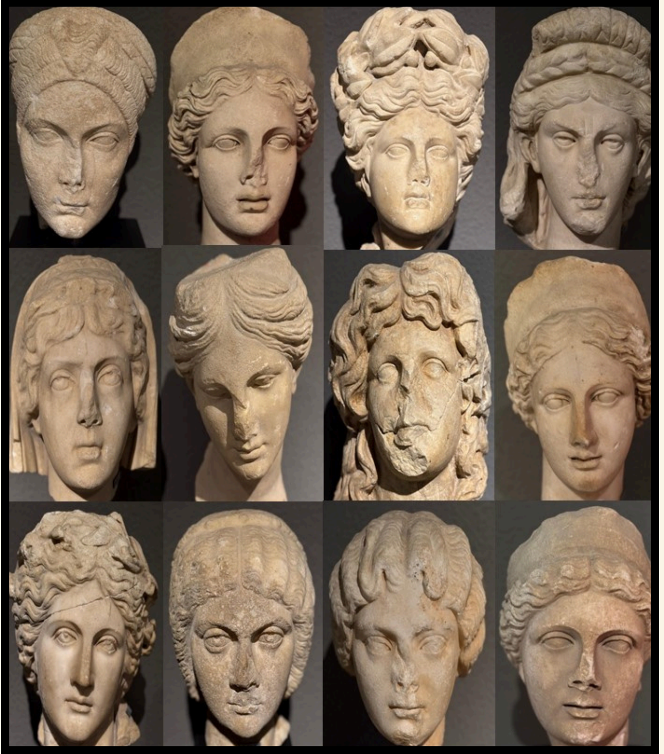
Pergeli Kadınlar, Antalya Müzesi

NOT: Metinde heykellere yönelik aktarılan teknik bilgiler dışında kalan hikaye ve hikayede geçen isimler gerçeđe dayanmamaktadır ve yazar tarafından öyküleřtirme kurgusu amacıyla oluşturulmuřtur.