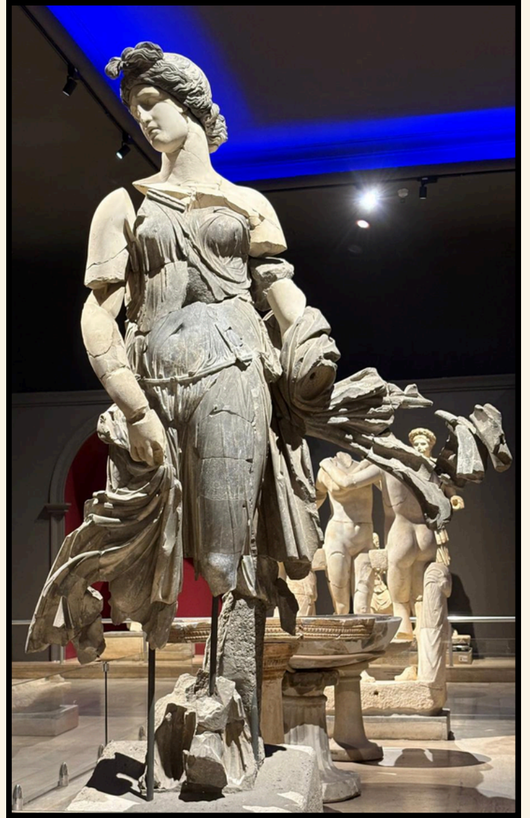
Dansöz, Antalya Müzesi

Aristeas'ın üzerinde çalıştığı Avcı Artemis'in hemen ötesinde üzeri büyük bir örtü ile kapatılmış başka bir heykel duruyordu. Eliyle işaret etti. Gaius hemen çekti heykeli örten örtüyü. Örtü kayarak yere düştü. Aslında hiçbiri gerçek adını bilmiyordu Aristeas'ın. "En iyi, en erdemli" anlamındaydı sözcük; Dansöz'ü görünce anladılar. Büyük bir suskunluk kapladı atölyeyi.