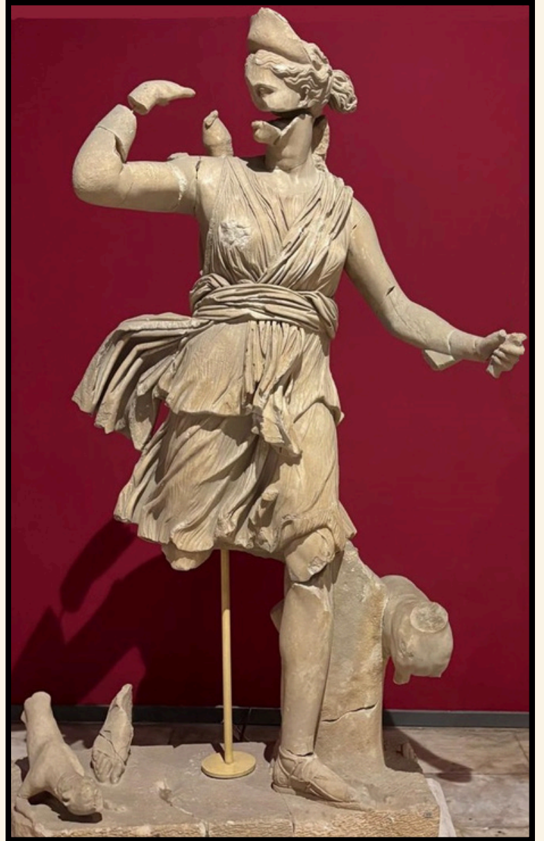
Avcı Artemis, Antalya Müzesi

heykel, bronz orijinalinin bir kopyasıydı. Saatlerce karşısında durup seyretmişti. Elbisesinin detayları, hele de o sağ elinin sırtındaki sadağa doğru uzanan duruşu bir büyü gibi kaplamıştı tüm benliğini.